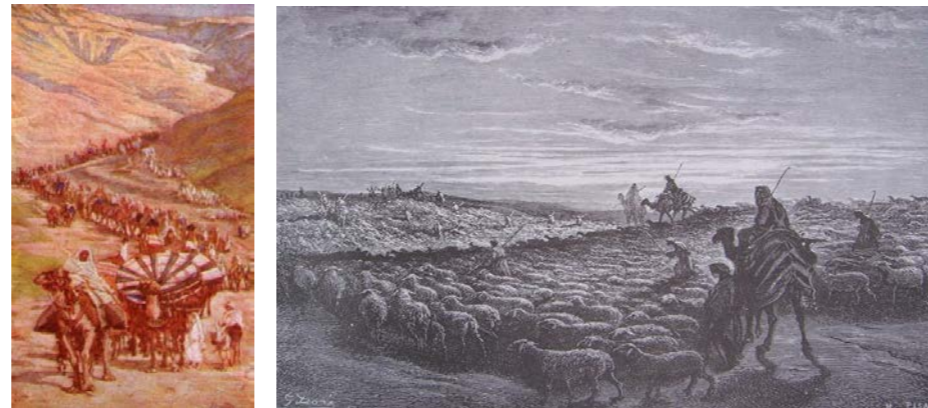
ウルからカナンへの旅路