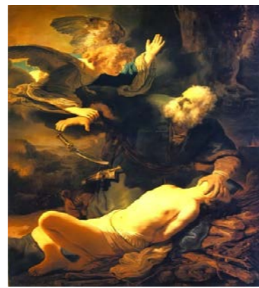
イサクを献げるアブラハム